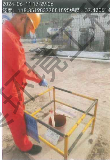
图 4 3#点位地下水采样照片