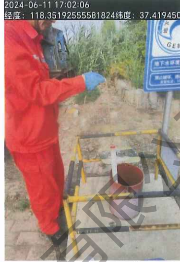
图 3 2#点位地下水采样照片