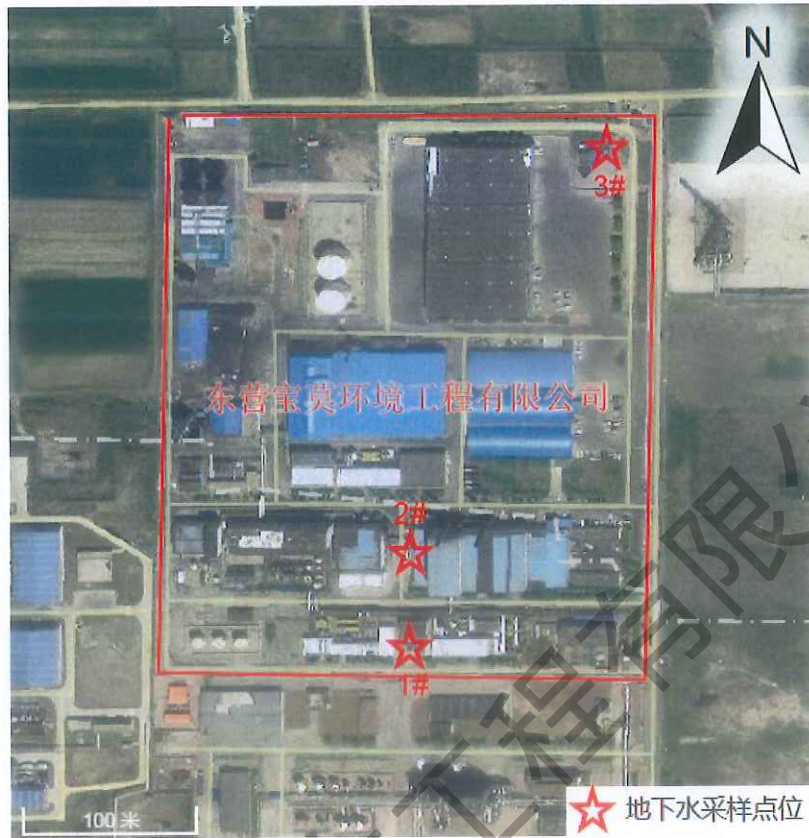
图1 地下水检测点位分布示意图