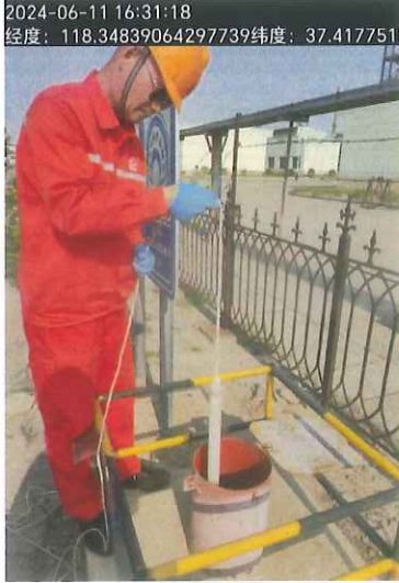
图 2 1#点位地下水采样照片